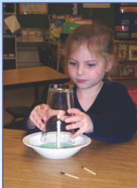
Abb. 1: Kerzenversuch im Kindergarten