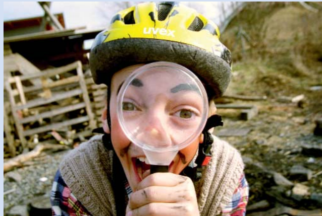
Abb. 3: Sie „spielen“ Forscher und Arzt

sich nur noch bis ans Ende der Straße unbeaufsichtigt bewegen darf; zur Schule wird er mit dem Auto kutschiert. Richard Louv hat den Begriff „Natur-Defizit-Störung“ geprägt, um die Symptome eines Kindes zu beschreiben, das sein Leben ausschließlich in geschlossenen Räumen verbracht hat [8] 1 . Hinzu kommt das Verschwinden der Nutztiere aus der Landschaft. Die beschriebenen Veränderungen der Lebenswelt der Kinder müssen bei der Frage nach „naturwissenschaftlicher Bildung“ berücksichtigt werden. Die Bildungsinstitutionen, vom Kindergarten bis zu den weiterführenden Schulen müssen